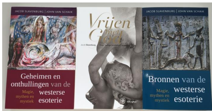
De laatste boeken, geschonken door de auteur, die opgenomen zijn in de bibliotheek.

Als u lid wilt worden van de bibliotheek dan kunt u dit middels een mail aan info@jungiaansinstituut.nl kenbaar maken, u ontvangt daarna een factuur. Na het voldoen van deze factuur ontvangt u van ons uw lenerspas.