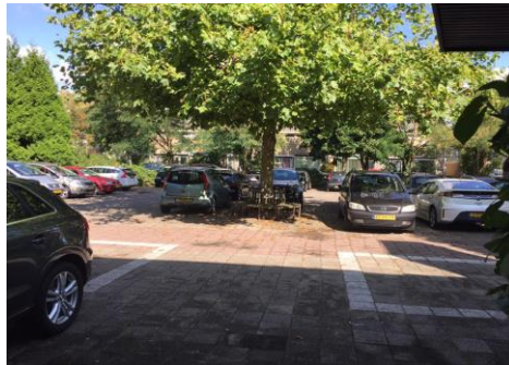
Na een lange zomer staat de parkeerplaats weer helemaal vol.

Het nieuwe collegejaar is zaterdag 2 september j.l. van start gegaan en studenten en docenten van de vierjarige opleiding Jungiaans Analytische Therapie zijn weer wekelijks aanwezig op het Jungiaans instituut. De nieuwe groep eerstejaars studenten is op vrijdag 6 oktober j.l. begonnen en er wordt ook weer volop getraind.