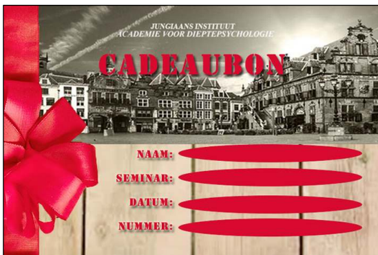
Seminar cadeaubon; "Leuk om te krijgen, leuk om te geven" .

Suggesties voor sprekers in het kader van seminars zijn welkom.